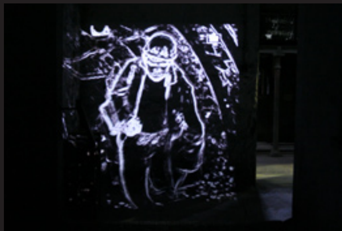
Pavel Mrkus, Tribute To Miners , 2007

V den vernisáže v řetězkové šatně Pavel Mrkus prezentoval AV performance podobně upravených sekvencí z dokumentárních filmů v kombinaci se zvukovými kompozicemi. Zrcadlení metamorfovaných obrazů strukturované rytmem syntetického, plně znějícího zvuku ve velkoplošné projekci bylo bezesporu působivé, zvláště žlutohnědě proměněná chodba s horníky, která přerůstala v dynamickou organickou kompozici. Následující vizuálně mixované sekvence pohybujících se abstraktních obrazců v nekonečných variantách mohou být určitě promítány v neutrálních prostorách. Je otázka, zda budou vnímána ostřeji, bez pomoci zvláštního prostředí. Toto jsou vcelku známé obtíže site specific projektů. Vnesené, jakkoli kvalitní práce, nekomponované přímo pro dané prostředí, jsou pak více zranitelné či sterilní.