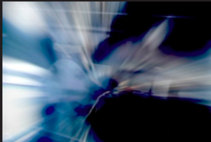
Pavel Mrkus, Run , live AV performance, 2007

Umění site specific projektů je zároveň procesem, sledem aktů v čase a umělecké dílo zde nabývá povahy časového objektu. Tyto objekty patří k typu předmětnosti, která obsahuje čas jako vlastní dimenzi, jako nutnou podmínku existence. Dlužno podotknout, že tento život spjatý s časem lze prodloužit jako život recipovaného uměleckého díla (tedy život díla, které se vrací a připomíná), tedy status estetického objektu - uměleckého díla si pro vnímatele zachovává dlouho po skončení akce samotné. Proto je také časový odstup dobrý pro hodnocení tvůrčí činnosti. Alespoň pro autorku tohoto textu, které se vrací mlčenlivý výstup horníků Pavla Mrkuse, čas od času ji prostě mlčky jdou hlavou... U děl pracujících se zvukem pak pro vyvolání děl znovu v „život“ stačí zaslechnout melodii nebo zvuk, který byl součástí díla a náhle se stane prostředníkem mentálního návratu v čase.